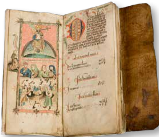
Register van de heilige geesttafel.

In het onderstaande verhaal voeren we jou met tekstdelen naast rode voetjes door de stad. We houden op verschillende plaatsen halt. Op elke plek kan je interessante gebouwen bewonderen en kom je meer te weten over een bepaald aspect van het voedselstelsel. Telkens als je stilstaat bij zowel de omgeving als het historische verhaal, nodigen we je uit om even de ogen te sluiten en je de middeleeuwse drukte en gang van zaken in te beelden. Daarnaast gaan we in enkele blauwe kaders wat dieper in op een bepaald aspect. En in de rode kaders vind je enkele smakelijke recepten uit de late middeleeuwen. Maar voordat we de stad in duiken, geven we een korte schets van hoe het er in het veertiende-eeuwse Gent aan toe ging. Je kan deze inleiding ook gerust op een later moment lezen, op een terrasje of in je zetel.