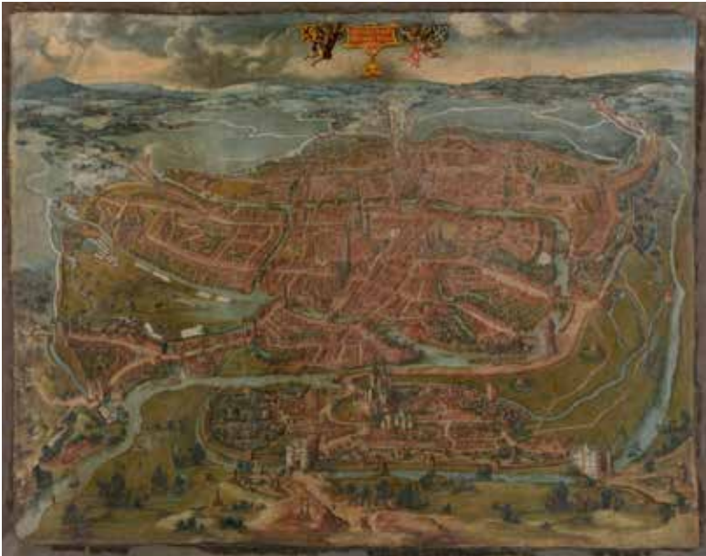
Panoramisch gezicht op Gent in 1534.

Voor de prominente plaats van Gent wordt terecht verwezen naar haar rol als productiestad, als centrum van de textielnijverheid in de Lage Landen. Samen met Brugge als internationale handelsstad maakte ze van Vlaanderen een economisch voorspoedig graafschap,